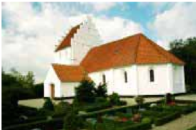
Allested Kirke tager sig flot ud i høj solskin

Det havde da været rigtig hyggelig med en tre fire par storke nede i Gl. Allested. Så havde vi da haft det vartegn som vi mangler rigtig meget.