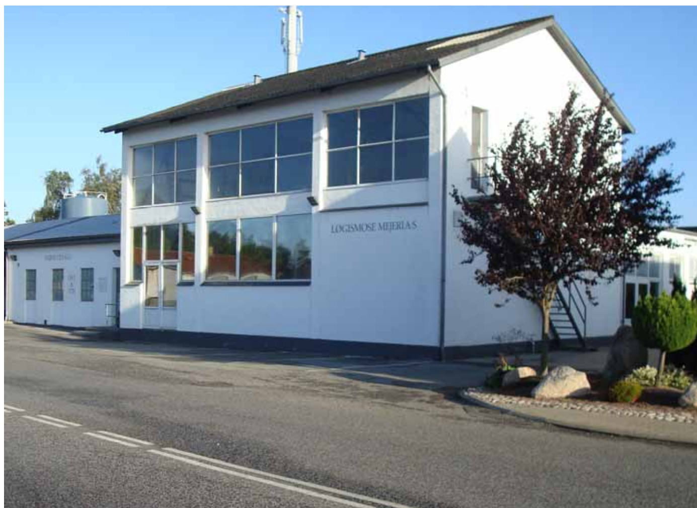
Løgismose Mejeri, en virksomhed, der er med til at brande Allested/Vejle

Lokalrådet er styregruppe for udviklingsplanen, og der er nedsat arbejdsgrupper på hver af de enkelte indsatsområder.