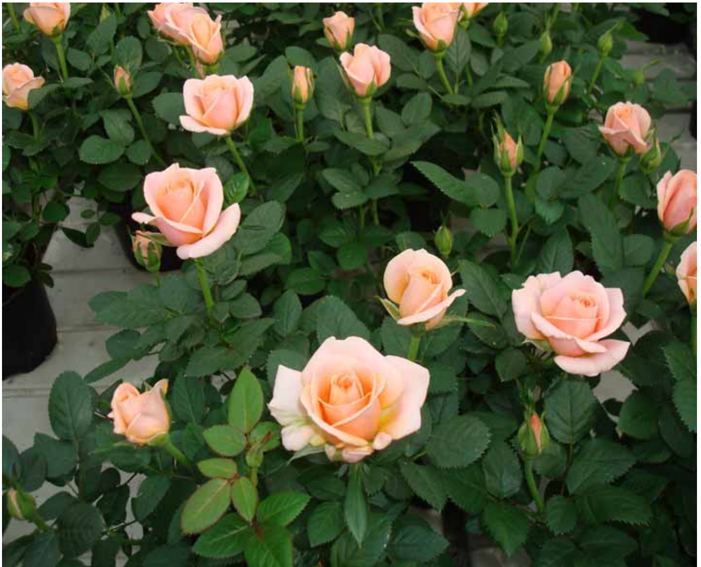
ROSER PYNTER OVER ALT