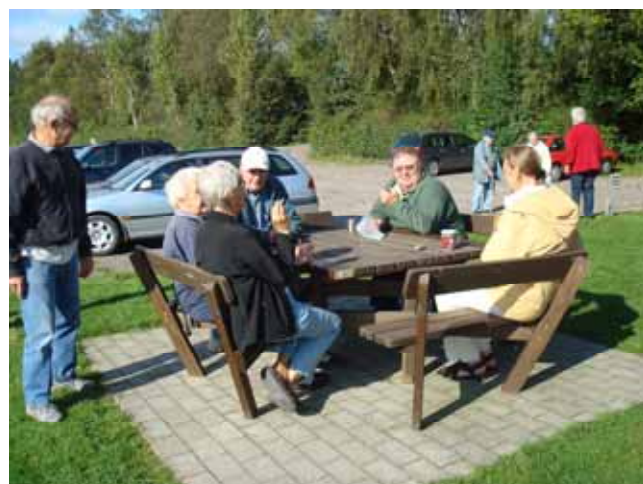
Lørdagshygge på sladrebenken.

Udover sport er der ikke ret mange aktivitetsmuligheder i hverdagen