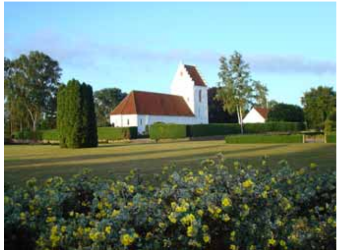
Vejle Kirke en dejlig solskinsmorgen

Det meste af det gamle Allesteds gårde brændte ved to pyromanbrande i 1908, i Vejle brændte flere gårde i 60'erne og 70'erne.