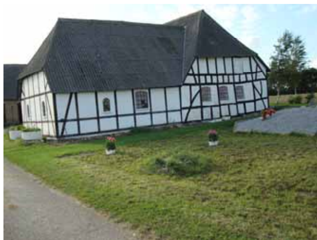
Og det er bare idyl og nostalgi.