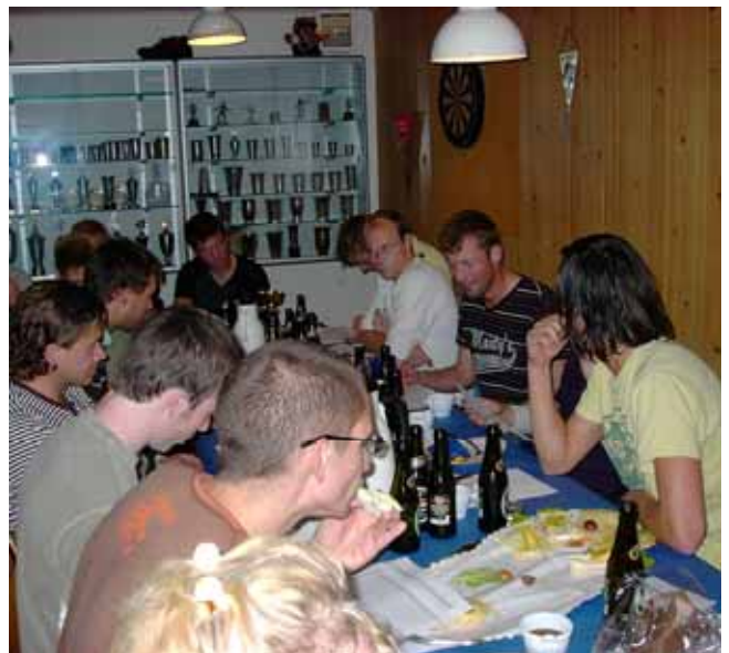
AUI kunne godt bruge noget mere plads